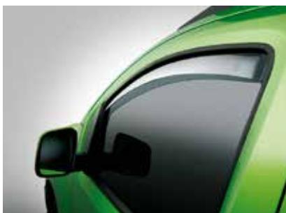
50901915 Windgeleiders voorportieren (montage zonder boren) Prijs incl. BTW: 50,-*