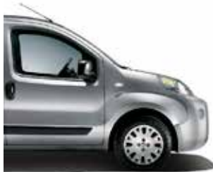
612 Minimal Grey metaalkleur