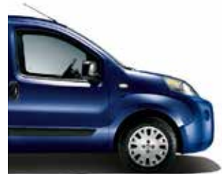
487 Cool Jazz Blue metaalkleur