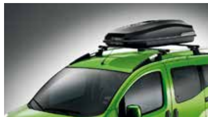
71805134 Dakbox, inhoud 490 liter 195 x 80 x 40 cm, met Fiat logo achterop Prijs incl. BTW: 428,-*