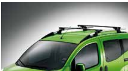
50902133 Dakdrager set (alleen i.c.m. optie 375) Prijs incl. BTW: 162,-*