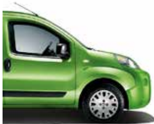
355 Disco Green metaalkleur