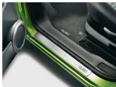
50902358 Instaplijsten met Qubo logo Prijs incl. BTW: 106,-*