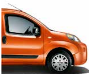
551 Funky Orange speciale pastelkleur