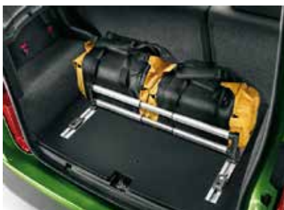
71805990 Kofferbak organiser Prijs incl. BTW: 370,-*