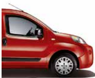
168 Breakcore Red pastelkleur