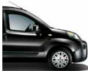
632 Rockabilly Black metaalkleur