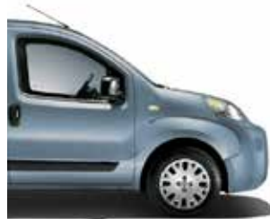
448 Azure Blue metaalkleur