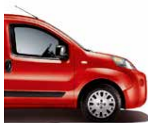
293 Red metaalkleur