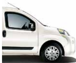
249 Ambient White pastelkleur