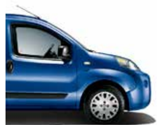
479 Line Blue speciale pastelkleur