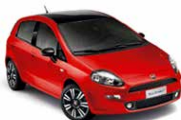
Exotica Red (176), pastellak