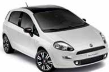
Glory White (296), pastellak