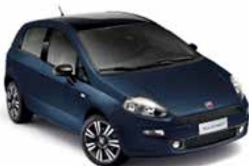
Rock 'n Roll Blue (475), pastellak