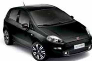
Crossover Black (876), metaallak