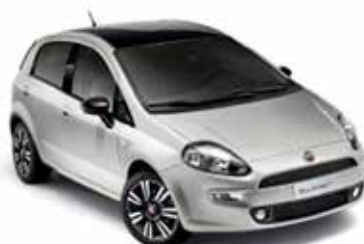
Tech House Grey (348), metaallak