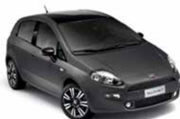
Underground Grey (679), metaallak

*Afbeeldingen kunnen afwijken van de werkelijkheid